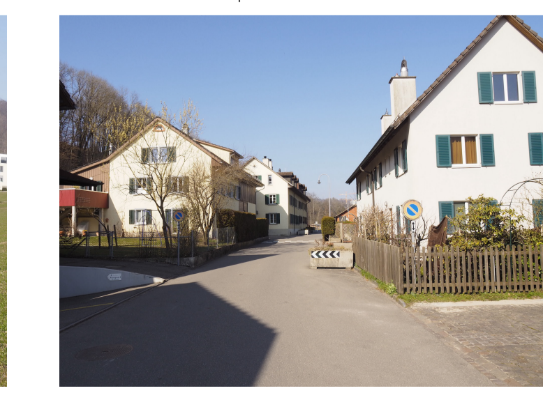
Landschaftsbild und Naturraum stärken